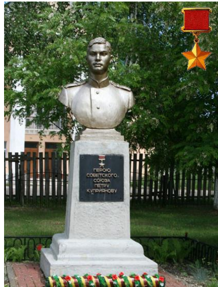
Памятник Петру Куприянову в Жодино

Имена многих наших соотечественников стали легендарными.