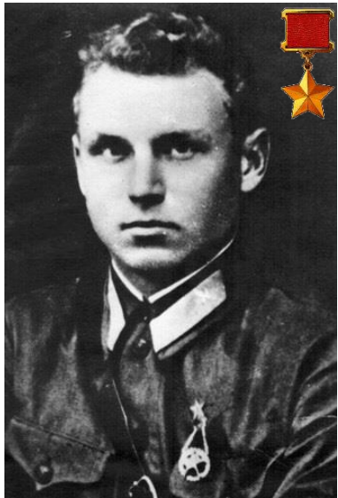
Александр Константинович Горовец

Войсковыми соединениями командовали 217 генералов и адмиралов — белорусов.